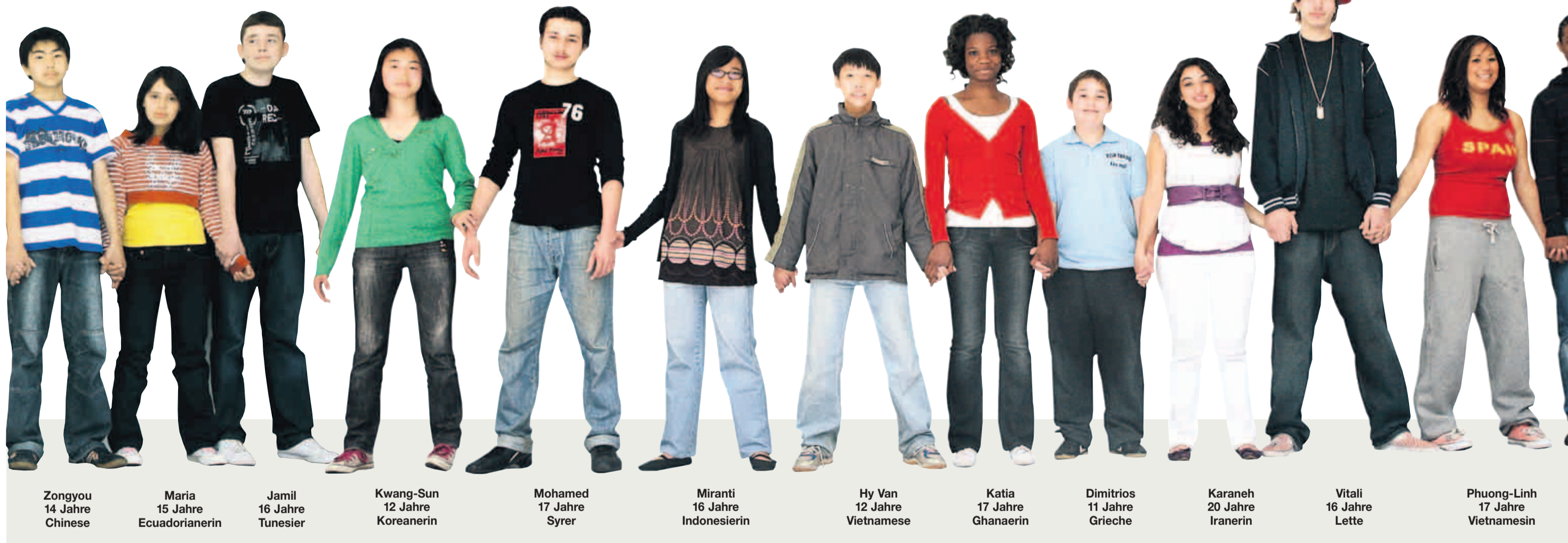
Zongyou 14 Jahre Chineser

Es ist eine Gemeinschaft, in der jeder auf seine Art etwas Besonderes ist.