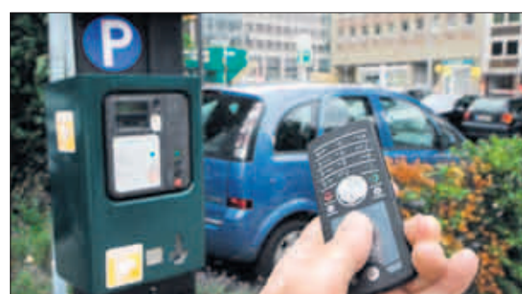
Statt des Parkscheins genügt das Mobiltelefon: Ab sofort bietet auch die Hansestadt Handyparken an.

die Parkzeit hingegen minuten-genau abgerechnet. Wer vergisst, sich nach dem Parken wieder abzumelden, wird nach zwei Stunden – nach Ablauf der Höchstparkdauer – per SMS informiert. Dann muss er die Kosten für zwei volle Stunden tragen. Dafür ist es mit dem neuen System möglich, wenn auch verboten, die Höchstparkdauer einfach per Telefon zu verlängern, eine Sperre gibt es nicht. 300 000 Euro hat das neue System gekostet: Die 350 Scanner der Politessen mussten aufgerüstet werden. Ihre Einnahmen aus Parkgebühren, jährlich knapp sieben Millionen Euro, wird die Stadt mit Handyparken aber wohl nicht steigern: In Köln, wo ein ähnliches Projekt läuft, nutzen nicht mal ein Prozent der Autofahrer Handyparken. Und auch in Hamburg werden die klassischen Parkscheinautomaten uneingeschränkt weiter betrieben.