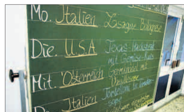
Die ganze Welt auf einem Speiseplan: In der Kantine gibt es landestypische Gerichte - von italienischer Lasagne bis zum Texas-Hacksteak.