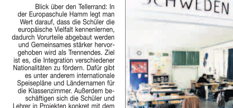
Die Klassenzimmer sind nach Ländern wie Schweden benannt.

Blick über den Tellerrand: In der Europaschule Hamm legt man Wert darauf, dass die Schüler die europäische Vielfalt kennenlernen, dadurch Vorurteile abgebaut werden und Gemeinsames stärker hervorgehoben wird als Trennendes. Ziel ist es, die Integration verschiedener Nationalitäten zu fördern. Dafür gibt es unter anderem internationale Speisepläne und Ländernamen für die Klassenzimmer. Außerdem beschäftigen sich die Schüler und Lehrer in Projekten konkret mit dem Thema „Europa“ und veranstalten jährlich Europa-Projektwochen.